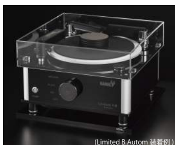
ダストカバー・トレー

機器の性能を維持するだけでなく、さらに向上させるためのアクセサリも取り揃えております。下記以外のラインナップ等、詳細はお問い合わせください。