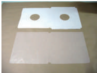
1. グラシン紙、上質紙、 自然澱粉のりの準備

作りを簡略化して安価にすることは容易ですが、本シリーズの1つ1つの工夫には大きな意義があると考えております。手間とコストのかかる作りではございますが、発表当時より一貫してこれを採用してまいりました。