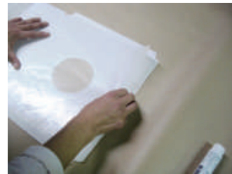
3. 上質紙とグラシン紙の糊付け