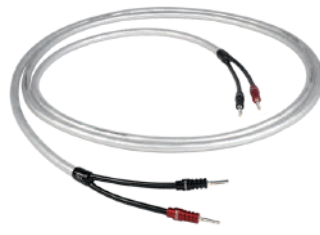
Clearway Speaker Cable