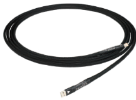
Signature SuperARRAY USB