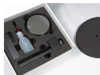
ネッシー7インチ盤クリーニング デラックスセット