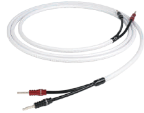
C-Screen Speaker Cable