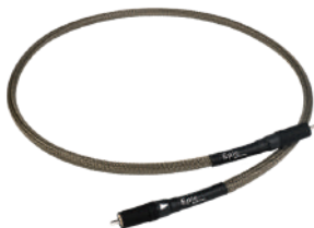
Epic Digital RCA