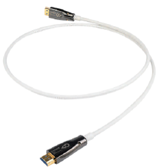
Epic HDMI AOC