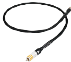
Signature Digital RCA