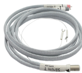
SarumT ToneArm Reference