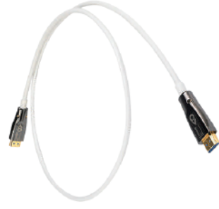
Epic HDMI AOC