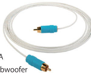
C-line RCA for Subwoofer