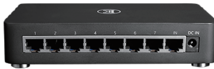
English Electric 8Switch (背面)