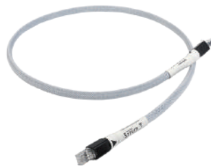
SarumT Streaming LAN