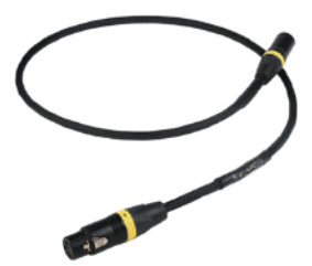
Signature Digital AES / EBU