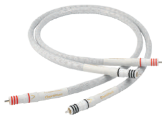
ChordMusic RCA - RCA for ToneArm