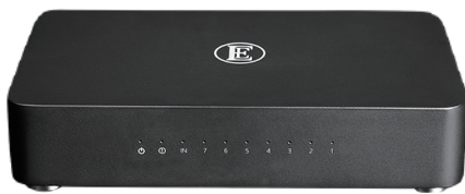
English Electric 8Switch (前面)