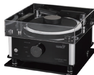
ダストカバー・トレー 使用例