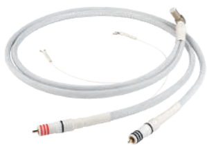
ChordMusic ToneArm Reference

例 : USB 2m の場合 (1m定価 ¥ 300,000 + 延長分1m @ ¥ 120,000) × 55% = ¥ 231,000