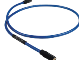
Clearway Digital RCA