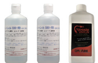
ハンル 500 RB・ハンル FB バイネリン 500