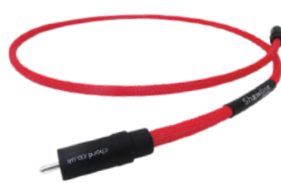
Shawline Digital RCA