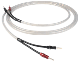
ShawlineX Speaker Cable

◎ 全スピーカーケーブル・リンクに「Ohmic」プラグ搭載 ( 切売り販売の場合を除きます。 / タイプ1とタイプ2の2種類を展開。詳細はカタログをご覧ください。 )