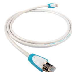
C-stream Streaming LAN