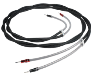
SignatureXL Speaker Cable