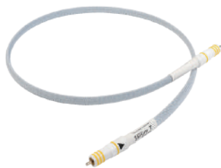
Sarum T Digital RCA