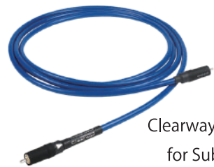
Clearway RCA for Subwoofer