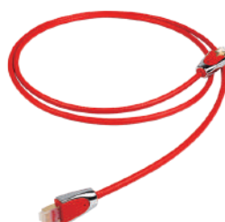
Shawline Streaming LAN