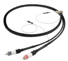
Signature TunedARAY ToneArm