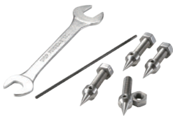
TH Spike M8 / 1.25 - 4