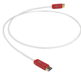
Shawline HDMI AOC