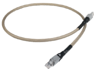
Epic Streaming LAN