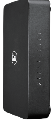
English Electric 8Switch