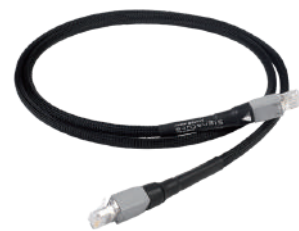
Signature Super ARAY Streaming LAN