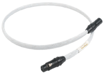
ChordMusic Digital AES / EBU