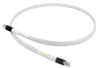
ChordMusic Streaming LAN

例：Digital RCA 2m の場合 （1m定価 ¥400,000+延長分1m @ ¥170,000）×55% = ¥313,500