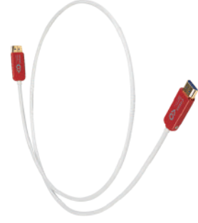
Shawline HDMI AOC