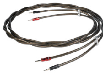
EpicXL Speaker Cable