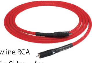
Shawline RCA for Subwoofer