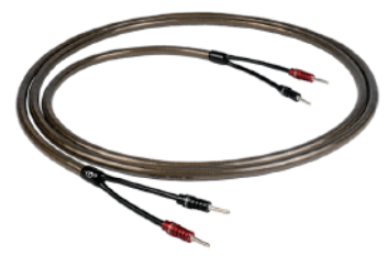
EpicX Speaker Cable