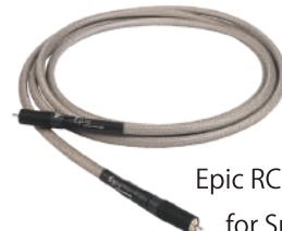
Epic RCA for Subwoofer