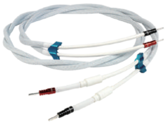
ChordMusic Speaker Cable