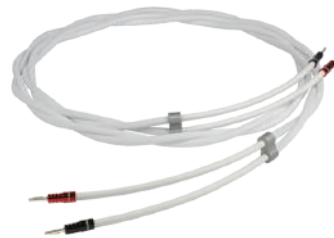
SarumT Speaker Cable